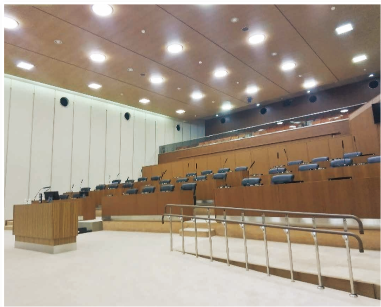
▲段差解消された議場

車いすの市議会議員として、市政の場に立たせていただきました。早速、議場のバリアフリーを進めていただき、心より感謝申し上げます。ありがとうございました。